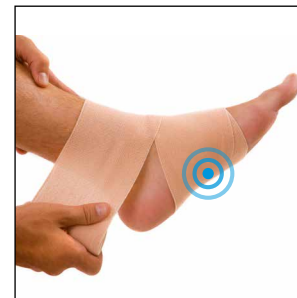
Brennt die Fußsohle?